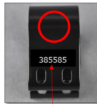
対策済みクランプ 385585 の記載あり

自主回収発表と同時に十分な代替品をご用意できないことを深くお詫びすると共に、何卒ご理解のほどお願い申し上げます。